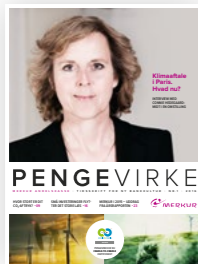
Temu: Klima I 2016 handlede Pengevirke om Klimaaftalen i Paris.

Som hun formulerede det med en vis skepsis i vores interview tilbage i 2016, så ville lakmusprøven for Parisaftalen være ”om regeringer, byer og virksomheder går hjem og laver nogle strategier, der rent faktisk passer til de intentioner, der er i aftalen. For det er jo