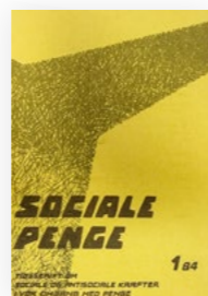
Det første magasin udkom i 1984 under navnet Sociale Penge.

Skrevet på skrivemaskine og med farvestrålende illustrationer på for- og bagside udkom Merkurs første tidsskrift for 40 år siden. Siden da har Merkur haft sit eget kundemagasin, som på forskellige måder har beskrevet, hvordan kundernes penge arbejder i verden.