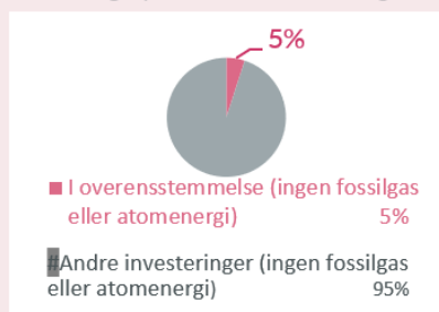
1: Investering i overensstemmelse med klassificeringssystemet inkl. Statsobligationer*